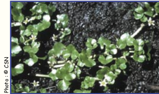
Renoncule à feuilles de lierre