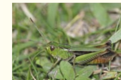
Criquet de la Palène

Des pelouses aux buissons, les papillons dansent leur bal éphémère. L'Agreste, typique des coteaux calcaires et particulièrement discret, vole de juin à septembre. L' Argus vert batifole et arbore son vert éclatant avec fierté.